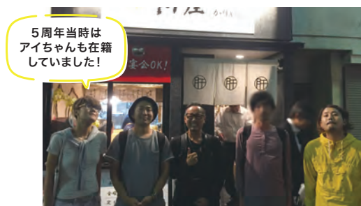
5周年当時はアイちゃんも在籍していました！